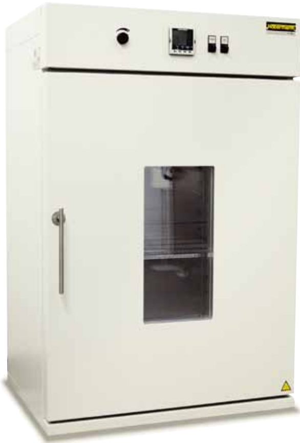
TR 450 con ventana