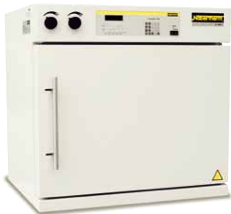
TR 60 con velocidad ajustable del ventilador