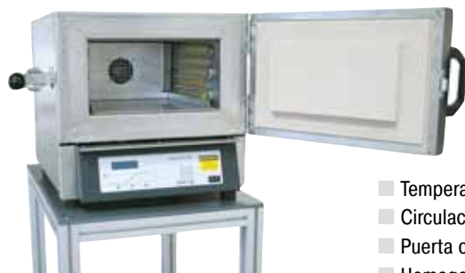
N 15/65HA como modelo de sobremesa

Estos hornos de cámara con aire circulante se caracterizan sobre todo por la excelente homogeneidad de la temperatura. Por lo que son excelentes para procesos como recocido, cristalizado, precalentamiento, endurecimiento, pero también para numerosos procesos para la fabricación de herramientas. Debido a su estructura modular, los hornos pueden adaptarse a las exigencias del proceso con accesorios funcionales.