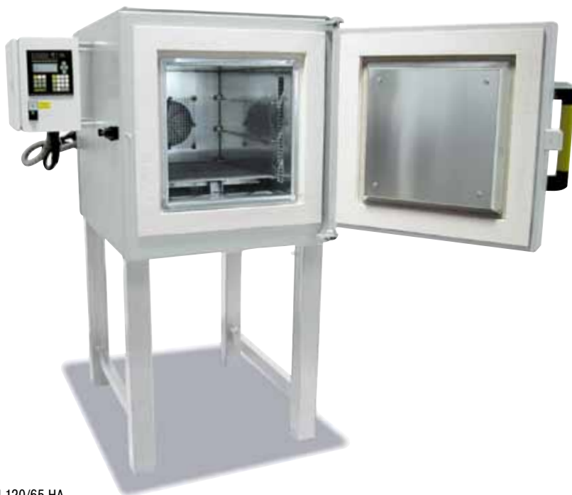
N 120/65 HA