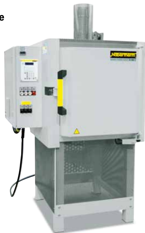
N 60/85HA con quemador de gas sobranante como equipamiento opcional