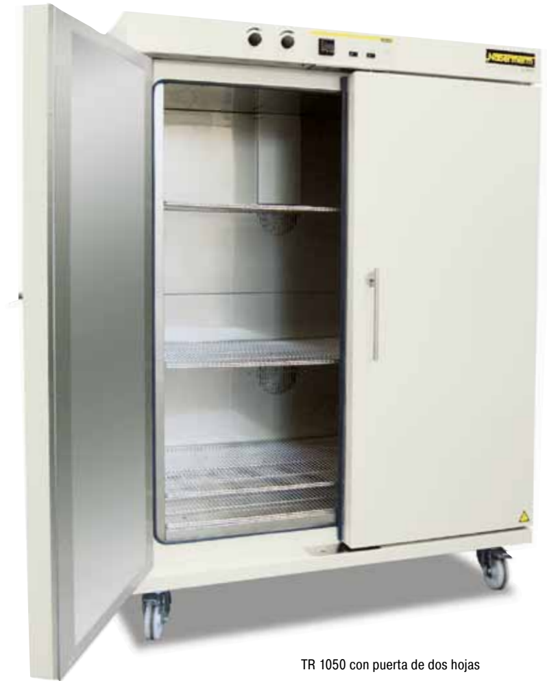
TR 1050 con puerta de dos hojas