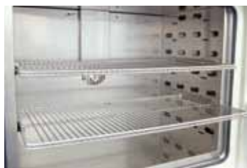
Rejillas extraíbles para cargar el armario secador en diferentes niveles