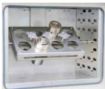
Dispositivo de giro eléctrico como equipamiento opcional

Gracias a una temperatura máxima de trabajo de 300 °C y a una circulación de aire forzada, las estufas alcanzan una homogeneidad de la temperatura, destacando frente a múltiples modelos de otras marcas. Pueden ser empleados en múltiples tareas, como p. ej., para secar, esterilizar o conservar en caliente. Gracias a un amplio surtido de modelos estándar, estamos en disposición de garantizar reducidos plazos de entrega.