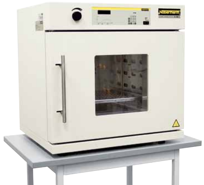
TR 60 con ventana